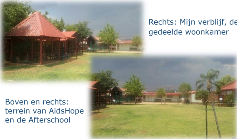
Rechts: Mijn verblijf, de gedeelde woonkamer

De komende weken zal ik de kinderen steeds beter leren kennen (ook qua achtergrond) en het afterschool-programma doorspitten. In december zal ik dan meer tijd hebben om mij voor te bereiden op de specifieke taken die ik volgend jaar zal hebben.